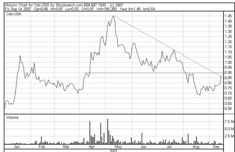
Chart U.S. Silver seit Januar 2007:

Auch die Aktie kommt nach dem Ausverkauf im Juli und August wieder deutlich in Schwung und konnte am Freitag den seit Mai vorherrschenden Abwärtstrend nach oben durchbrechen. Wichtig für die kurzfristige Entwicklung ist nun eine Stabilisierung auf diesem Niveau und ein Angriff auf den Widerstandsbereich um die 0,90 CAD. Wir gehen davon aus, dass dies spätestens mit den Produktionszahlen für das 3. Quartal geschehen wird und raten daher in den nächsten Tagen und Wochen die Aktie weiter zu kaufen. Unser Kursziel für U.S. Silver liegt bei 1,50 Euro auf die nächsten 6-12 Monate.